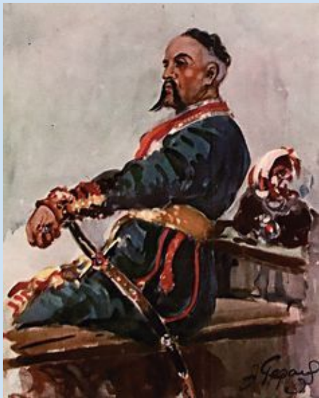
ГЕТЬМАН (назва вищих воєначальників)

Історизми – це назви тих предметів, явищ, понять, які відійшли в історію і зараз не вживаються.