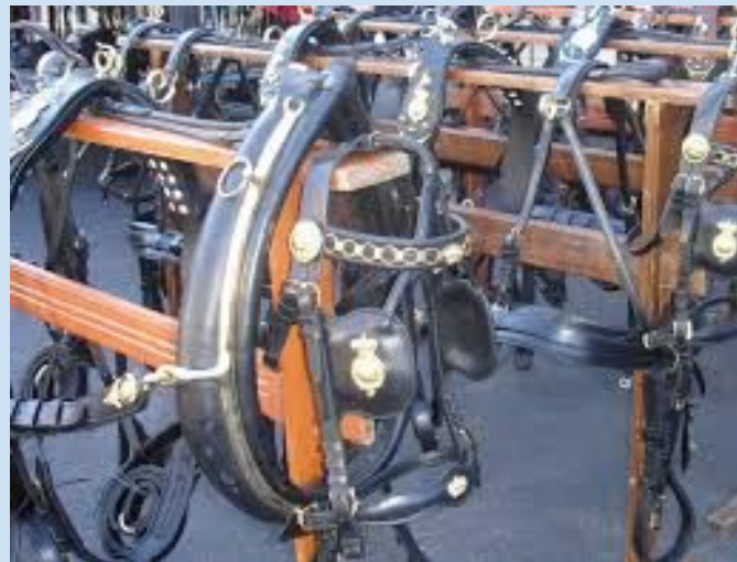
ЛИМАР (майстер, який виготовляє ремінну зброю)