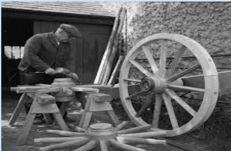
СТЕЛЬМАХ (майстер, який робить вози, сани, колеса тощо)